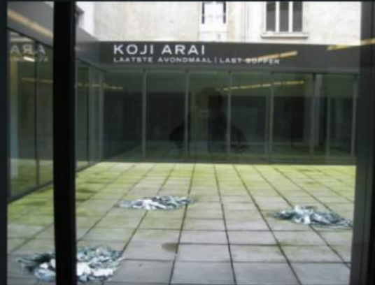
The crumbs of the Last Supper