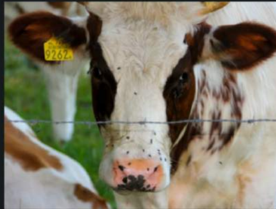
Toch geen mugshot