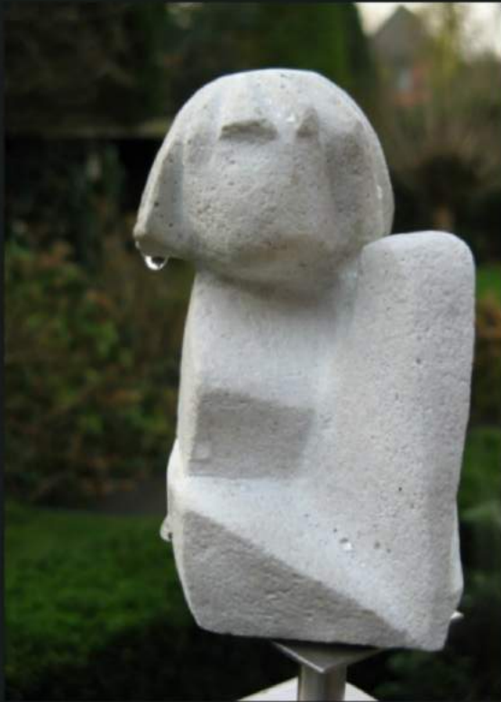
Eavesdropping is bad for you ...