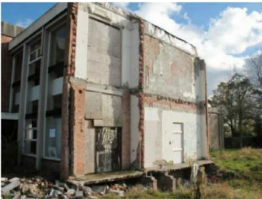
Welterusten, sloop lekker