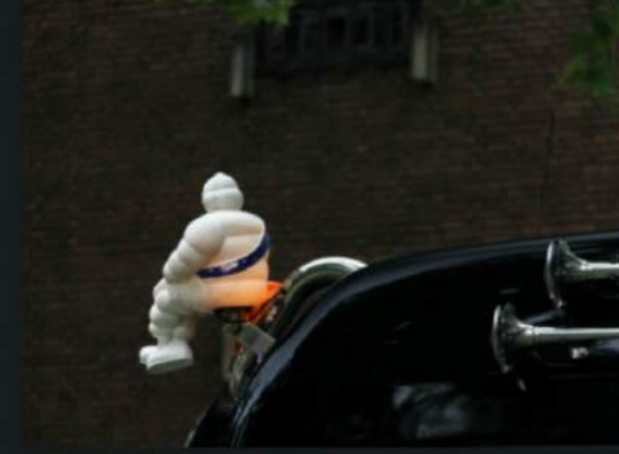
Blauwe band? Ben je betoeterd?