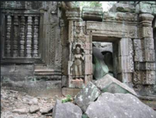
Open door day?