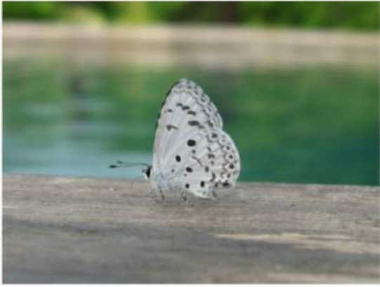
Didn't you get an inkling?