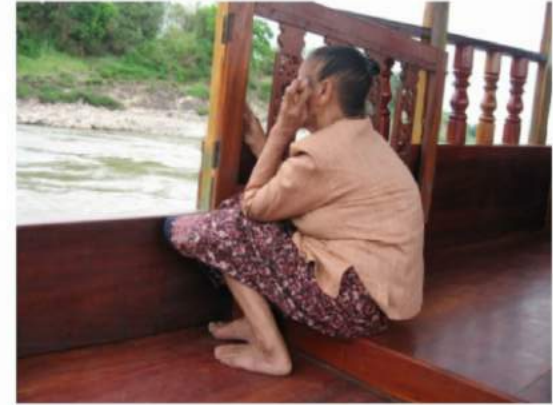
Wait and sea