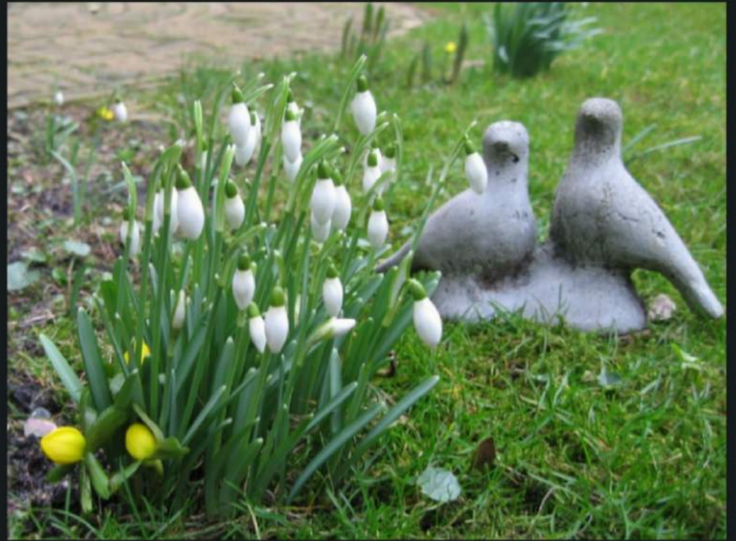
The Postman Always Rings Twice.