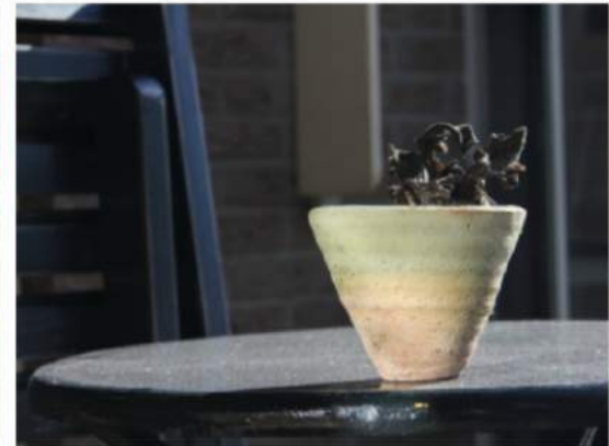
ik heb er een potje van gemaakt