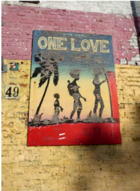
It's all in the (mono)game!