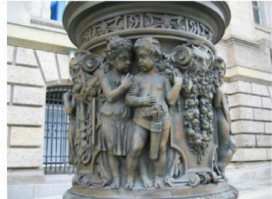
Psst ... are that your arrows?