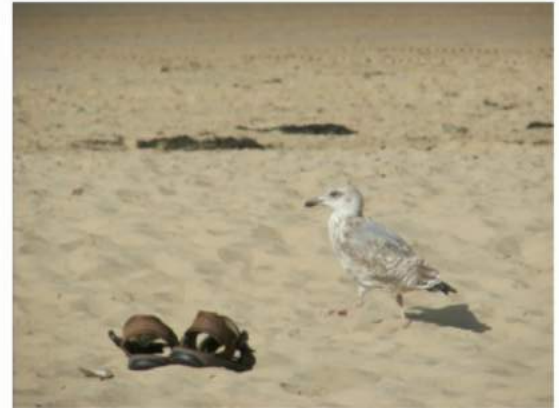
the day He was taken up to heaven