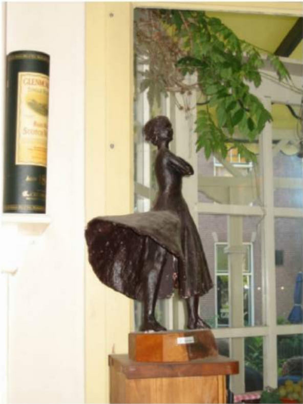
Whisky under the rocks