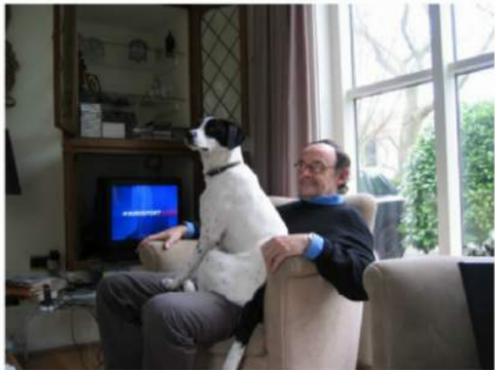
His Master's Voice.