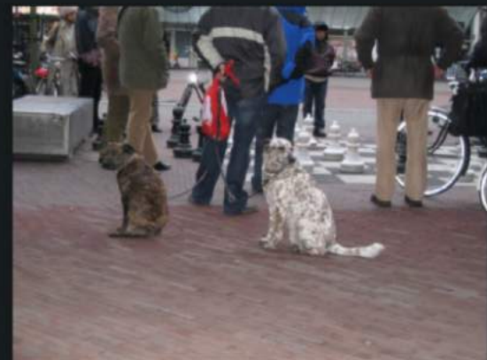
Out of the game ...