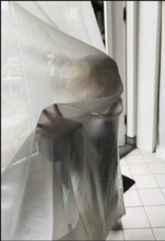
Waiijong, achter de schermen