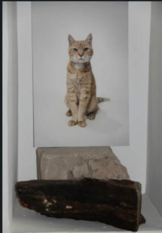
Kat en brokken