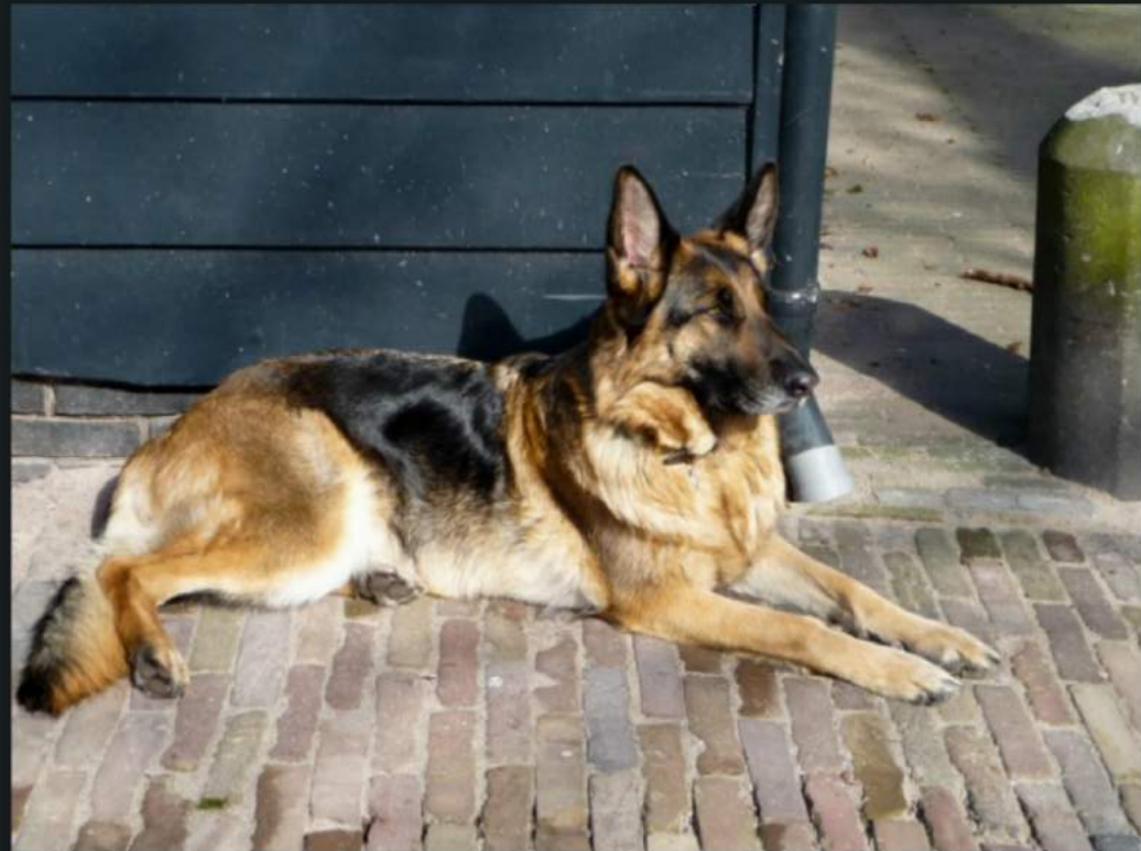
Van her & der