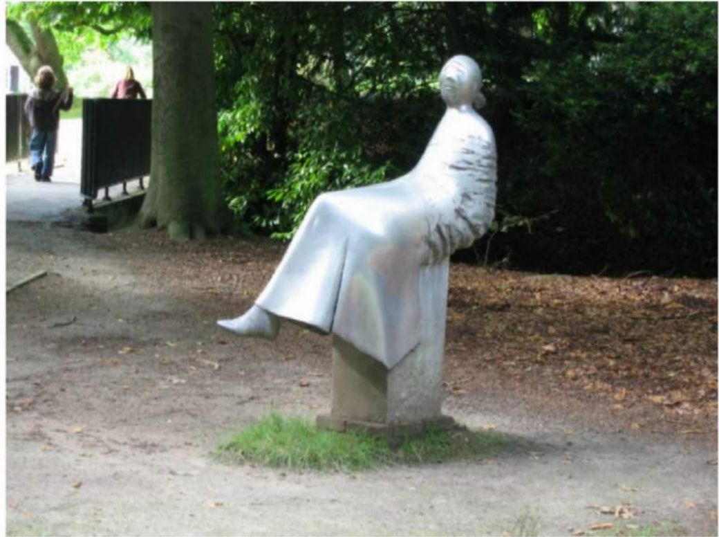
Aie, pole-sitting hurts