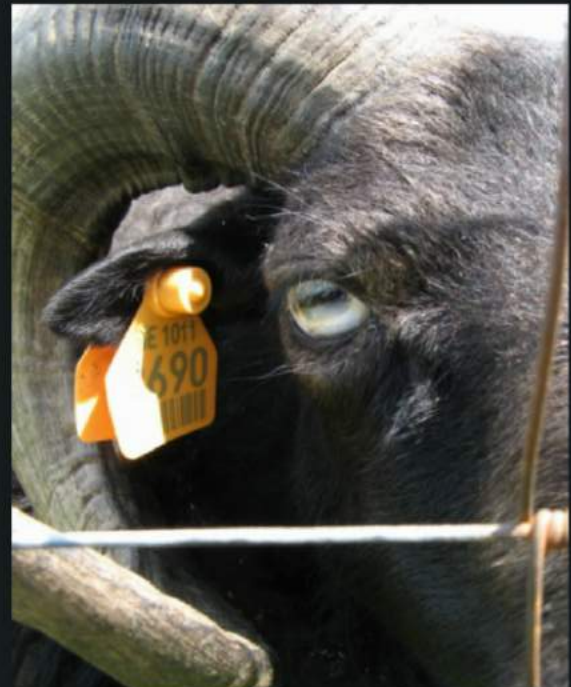
White and see!