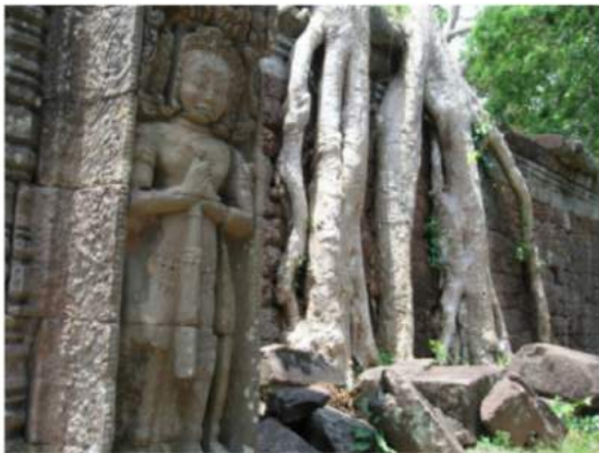
Still looking for her roots