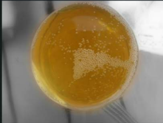
Con cider this