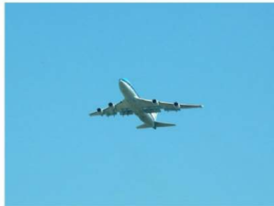
Don't come, plane!