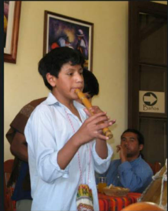
Come up, you lazy snake!