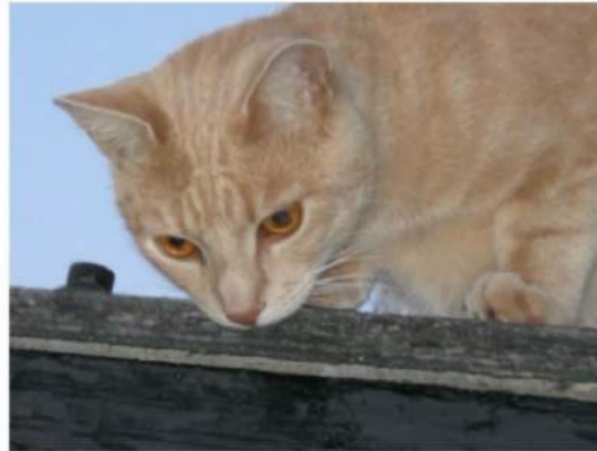
Hot Cat on a Tin Roof