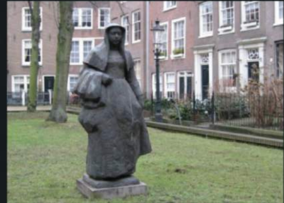
A new beguine