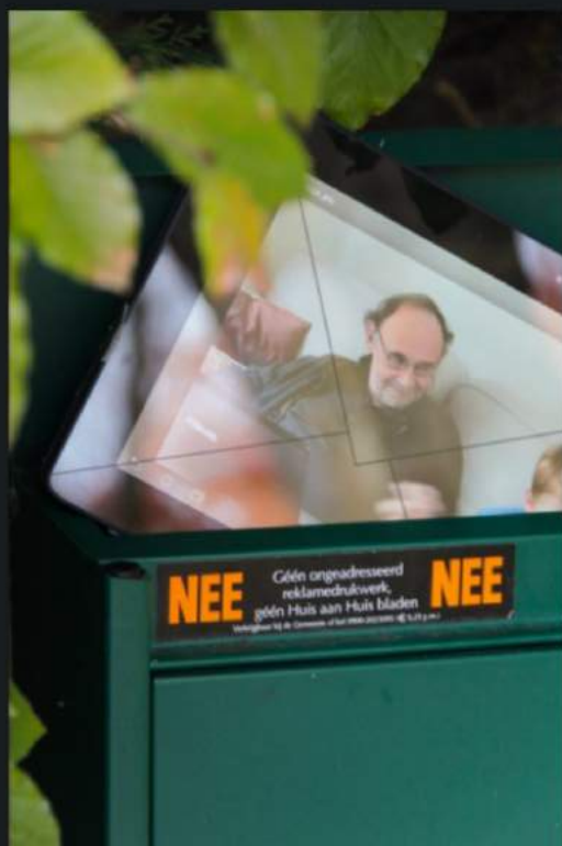
ik ben mailig