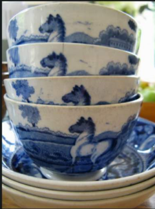
Olympic games in China: Jumping