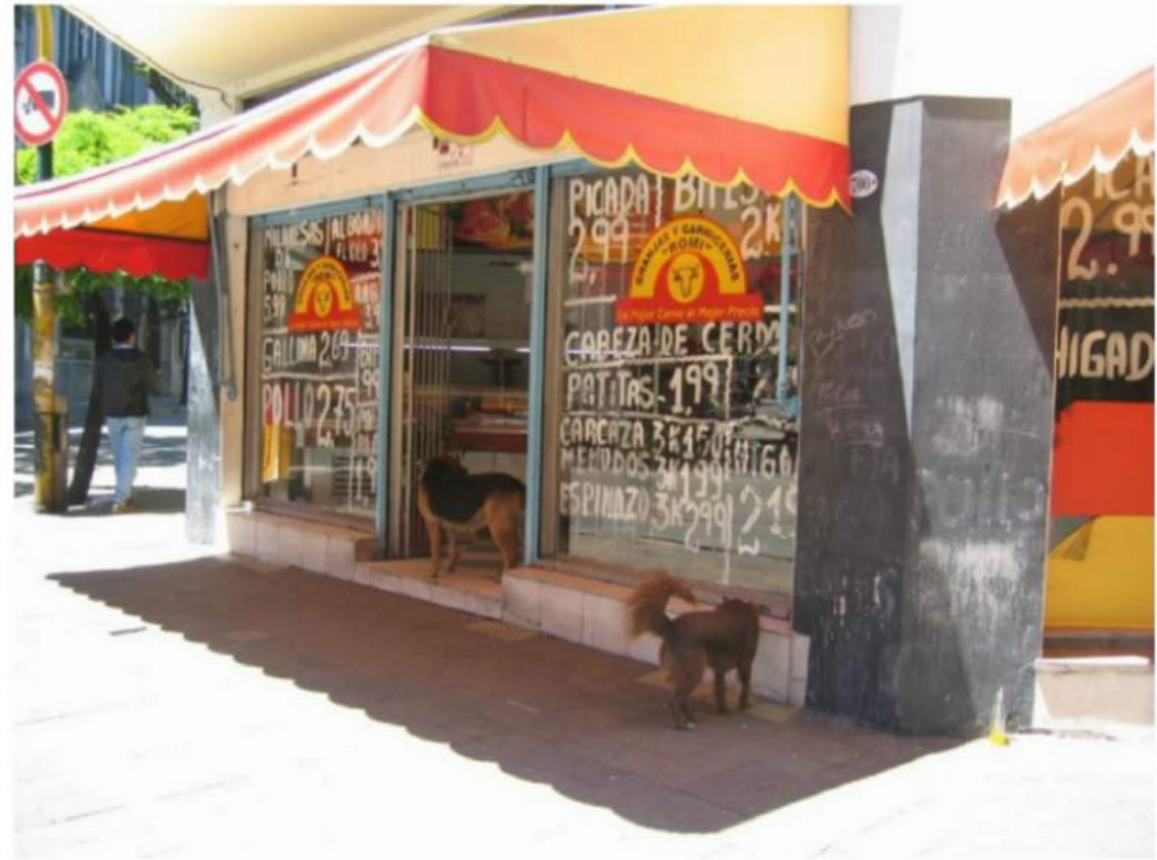
Dogs' meeting place