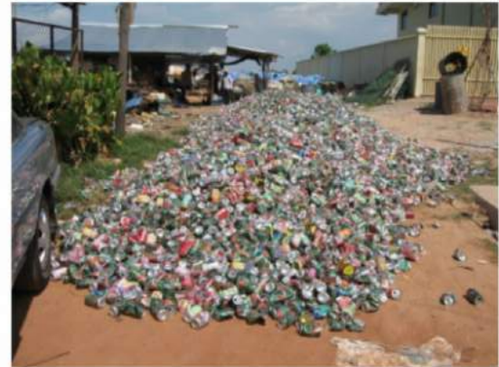
I can no more!