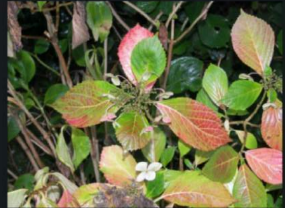
It's hard to be leaf!