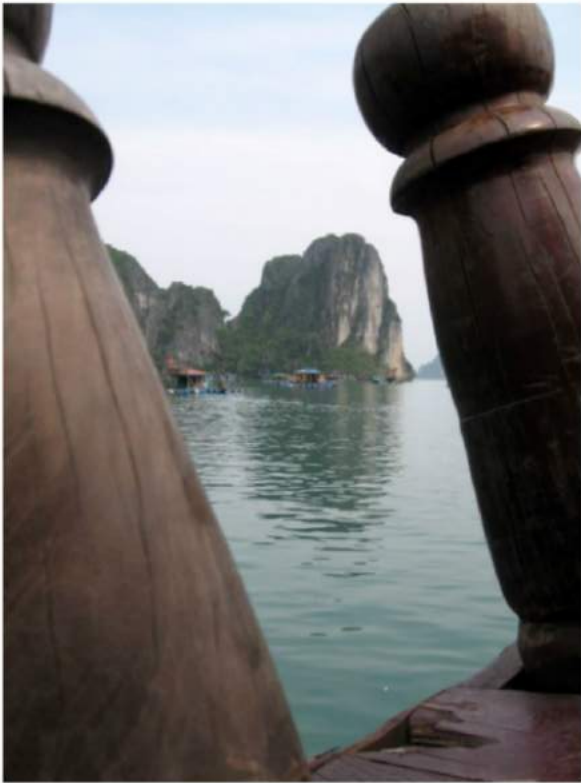
Rock & Roll