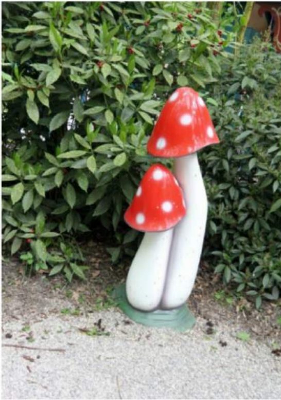
Ceci n'est pas de stoel