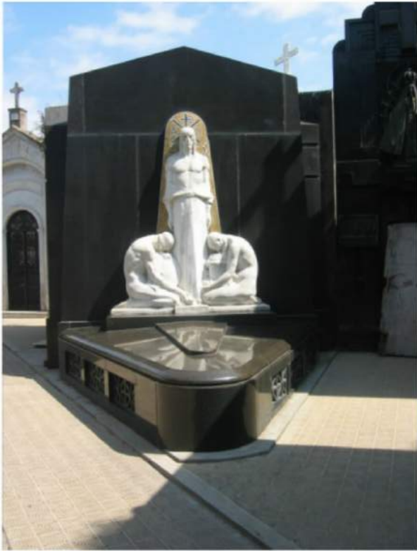
Middlefinger .I. memoriam