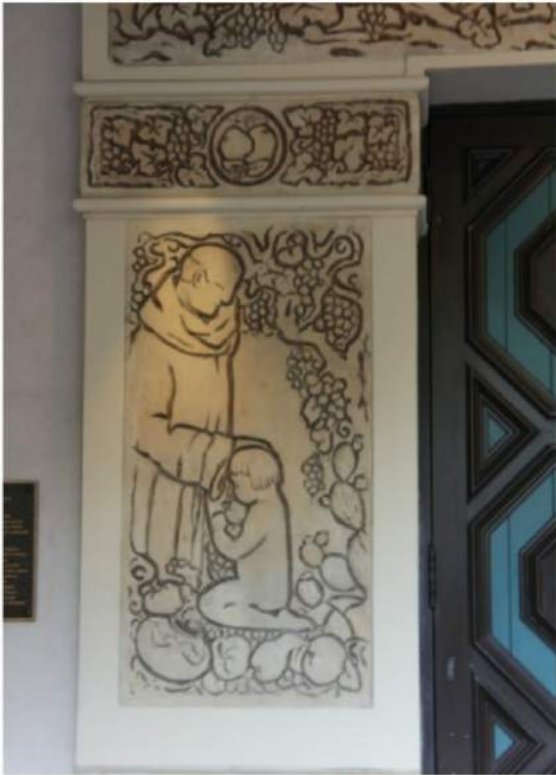
Sin of the first kind ...