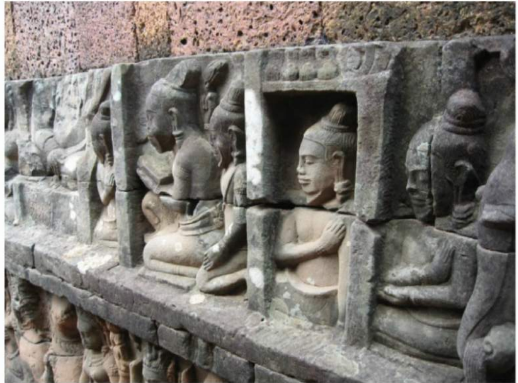
The girl nextdoors