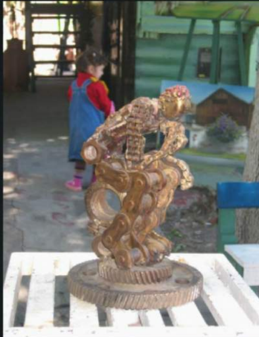
Chain of thoughts