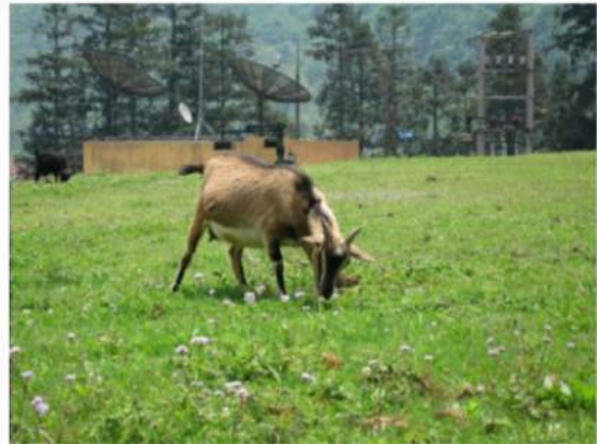
This goat's favorite dish