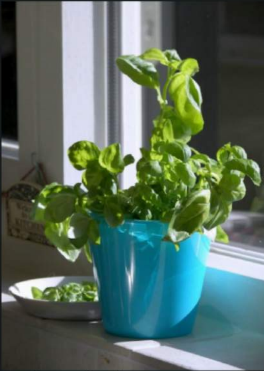
Basili cum laude