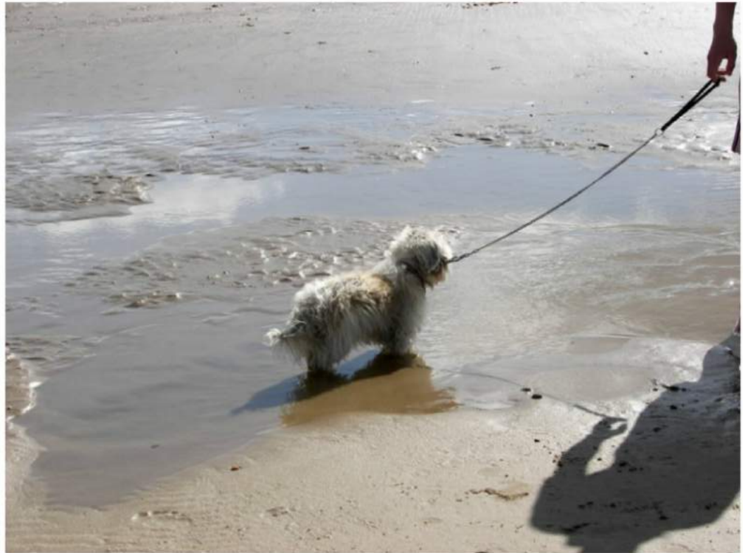
You see, it was high time to let me out!