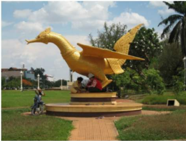
The goose with the golden legs