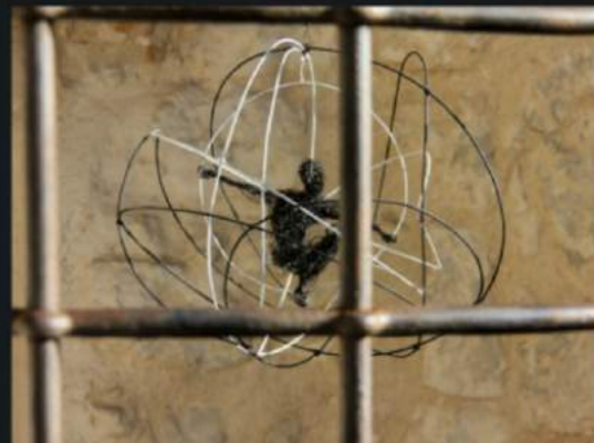
Hij is de draad kwijt!