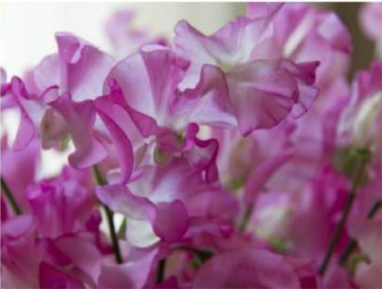
Laat die rus, héél laat!