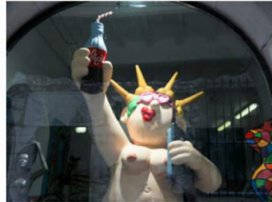
Let there be light!