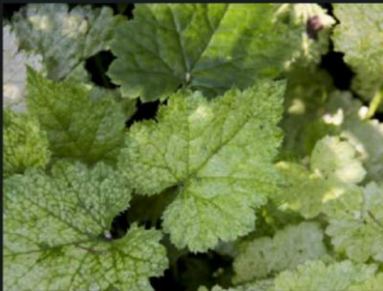
Kindje-op-moeder-schoot vader dood ...