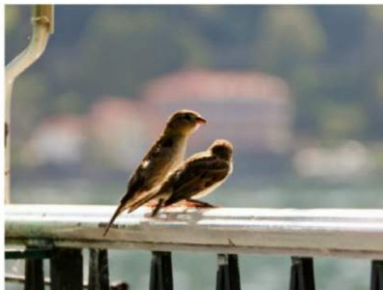
Alles darf, nichts muss