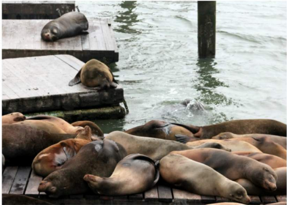
Nice to meat you!