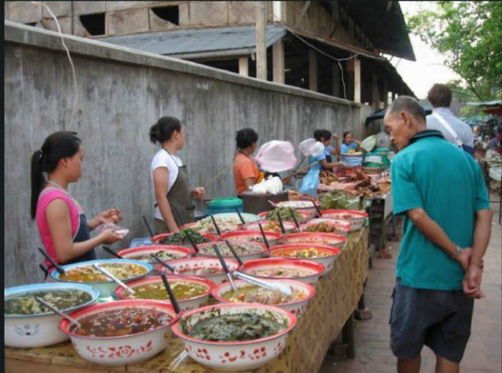
Soup pause, I suppose