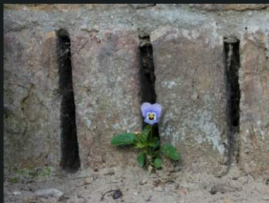
De eerste viool speelt ...