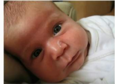
Onder vier ogen