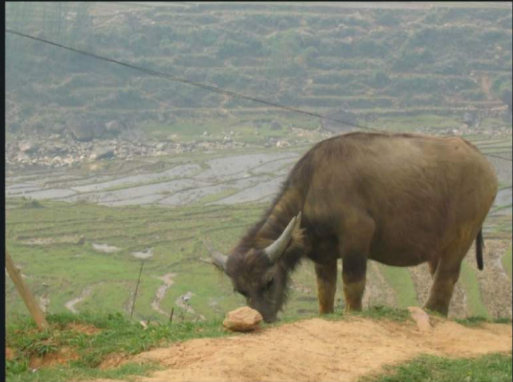
Bouffe à l'eau