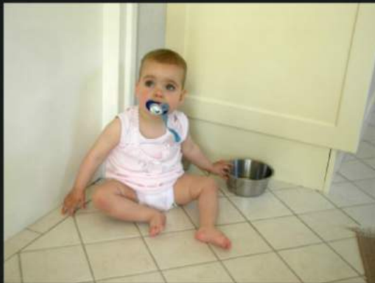
Is that my lunch for today?