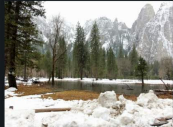
Ben je beyosemieterd?