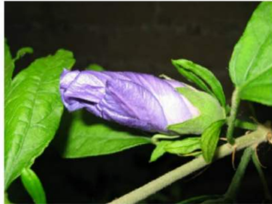
Not my fold