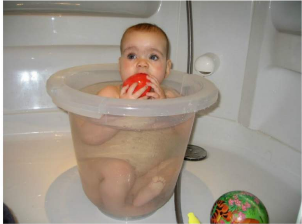
Tubby or not tubby?