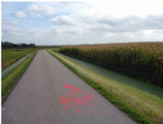
Over stekend wild