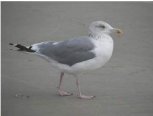
Single (pr. sin~gull)