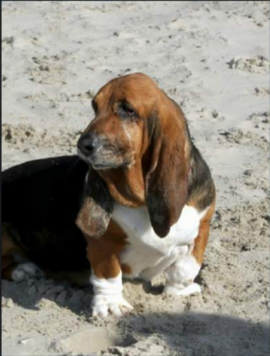
I'm all ears